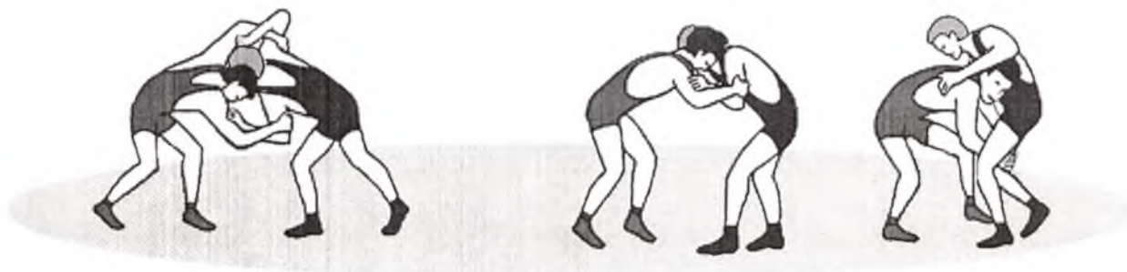
Задание 1. 1

Задание 2.3. Выполнить захват ноги в движении в правой (левой) высокой стойке.