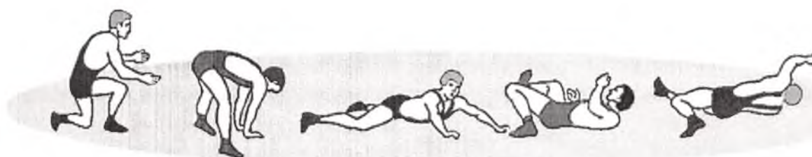
задание 1 задание 2 задание 3 задание 4 задание 5